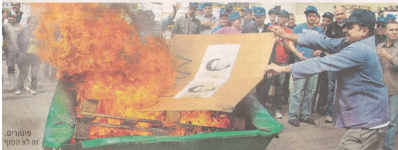
פיטורים, זה לא הסוף