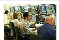
חדר מסחר בבורסה בת"א

3 תגובות ל "פקיעה סוערת בת"א: "שחקן גדול לחץ את המעו"ף לפקוע מתחת ל-1,010 נקודות"